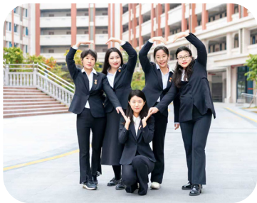
科技与发展规划处：